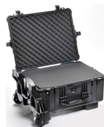
1610MWF With Foam