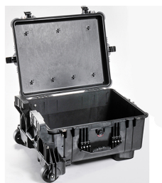
1610MNF No Foam