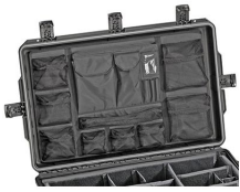
iM2875-UTILITYORG Pochette utilitaire