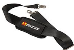
9487 Bandoulière rembourrée