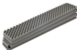
iM3410-FOAM Jeu de mousses de rechange, 4 pièces