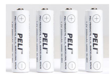
2469P Pile de recharge