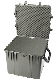
0370WF With Foam