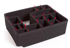
1560EUTP Kit de séparation de la valise TrekPak