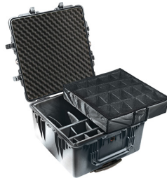
1644 With Padded Dividers