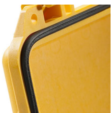
0373 Joint torique de remplacement