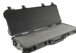
1720WF With Foam