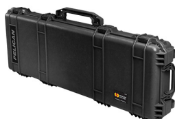
1720NF No Foam