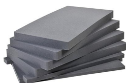
1781 Jeu de mousses de rechange, 6 pièces