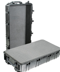
1780WF With Foam