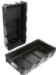
1780NF No Foam