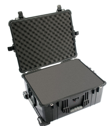
1610WF With Foam