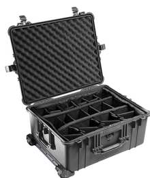
1614 With Padded Dividers