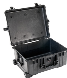
1610NF No Foam