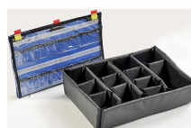
1505EMS Trousse d'accessoires EMS (classeur pour couvercle et jeu de séparateurs)