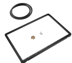
1520PF Cadre de panneau pour application spéciale