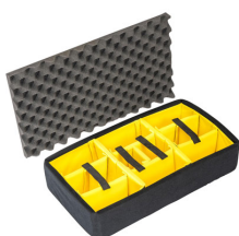
1555AirDS Cloison en mousse