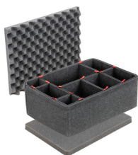
1557TPKIT Kit divisorio per valigie TrekPak