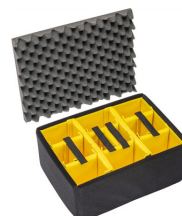
1557AirDS Set di divisori imbottiti