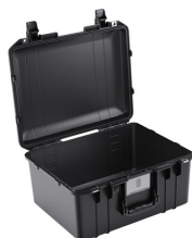
1557NF No Foam