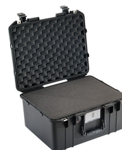
1557WF With Foam