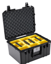
1557WD With Padded Dividers