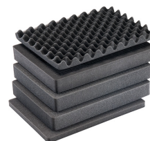
1557AirFS 5 pz. set ricambio schiuma