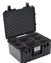
1557TP With TrekPak Divider System