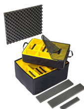
1637AirDS Set di divisori imbottiti