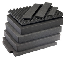
1637AirFS 8 pz. set ricambio schiuma