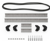
iM2306-MBEZ-B Lunetta della base (metrica)