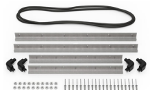
iM2700-M4-BEZEL Lunetta della base (metrica)