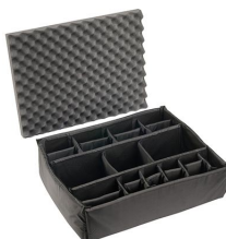
iM2700-DIV Set di divisori imbottiti