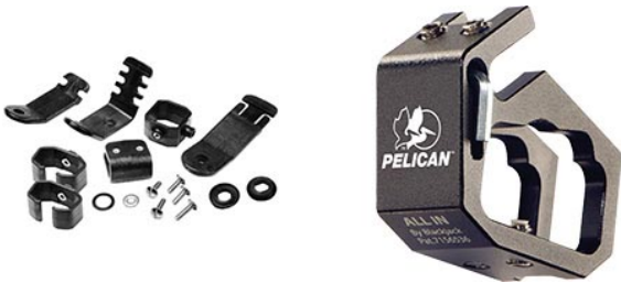
0770 Fissaggio da torcia per caschi 0782 Fissaggio da torcia per caschi