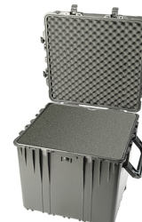
0370WF With Foam