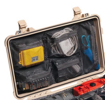
1519 Coperchio organizer