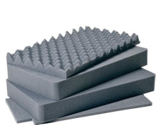
1511 4 pz. set ricambio schiuma