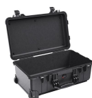
1510NF No Foam