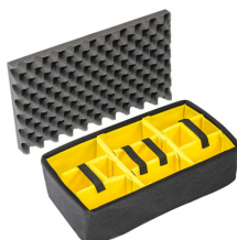
1515 Set di divisori imbottiti