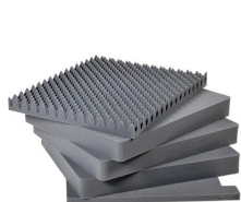
1691 5 pz. set ricambio schiuma