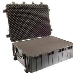
1730WF With Foam