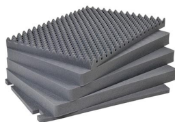
1731 5 pz. set ricambio schiuma