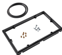
1120PF Telaio del pannello per applicazioni speciali