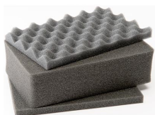
1121 3 pz. set ricambio schiuma