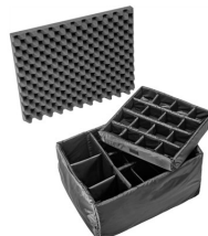
1625 Set di divisori imbottiti