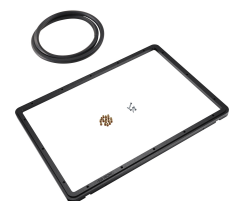
1520PF Telaio del pannello per applicazioni speciali