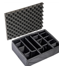
1525 Set di divisori imbottiti