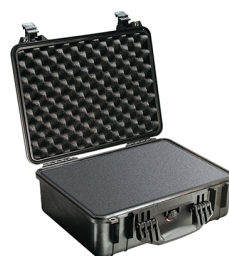
1520WF With Foam