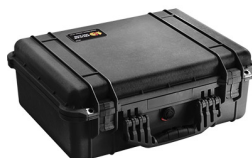
1520NF No Foam