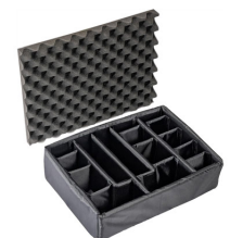
1525DS Set di divisori imbottiti