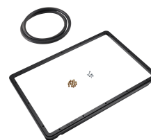
1520PF Telaio del pannello per applicazioni speciali