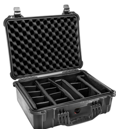
1524 With Padded Dividers