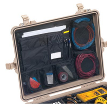
1609 Coperchio organizer