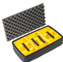
1525AirDS Set di divisori imbottiti