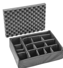
iM2400-DIV Divisores acolchados