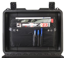
iM24XX-LIDORG Organizador de tapa