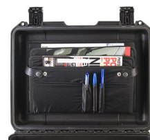
iM24XX-LIDORG Organizador de tapa