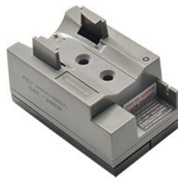
2480F Base de cargador