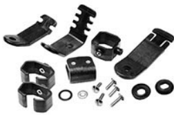
0770 Soporte de linternas para cascos