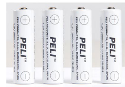
2469P Batería de recambio