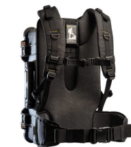
RucPac-Pro-1 Conversión de mochila RucPac Pro Hardcase