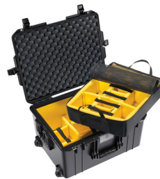
1607WD With Padded Dividers