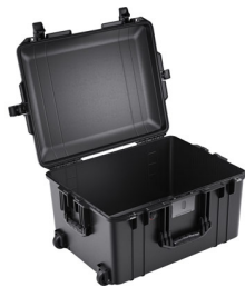
1607NF No Foam