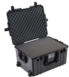
1607WF With Foam