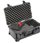
1510TPF TrekPak / Foam Hybrid