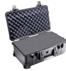
1510WF With Foam