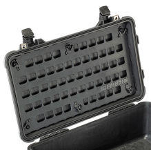
1510MP EZ-Click™ MOLLE Panel