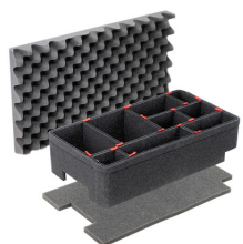
1510TPKIT TrekPak Koffer Teiler Kit