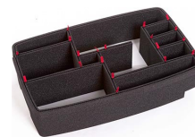
1510EUTP TrekPak Koffer Teiler Kit