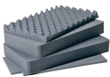
1511 4 St. Ersatz- Schaumstoffeinsätze