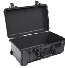
1510NF No Foam