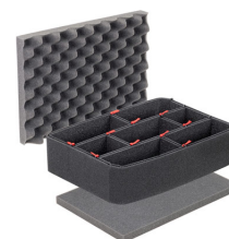
1450TPKIT TrekPak Koffer Teiler Kit