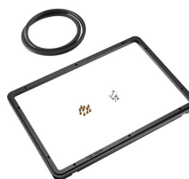
1450PF Panelrahmen für Spezialanwendungen