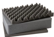
1451 3 St. Ersatz-Schaumstoffeinsätze