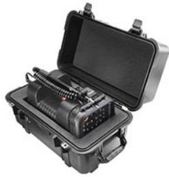
1460AALG 1460 Schutzkoffer mit passendem Schaumstoffeinsatz