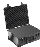
1560WF With Foam