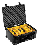
1564 With Padded Dividers