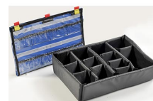
1505EMS EMS Accessory Set (Lid Organizer and Divider Set)