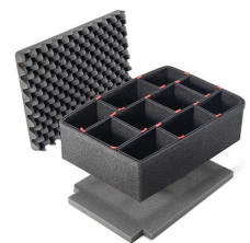
1500TPKIT TrekPak Koffer Teiler Kit