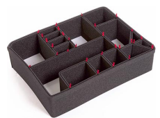
1600EUTP TrekPak Koffer Teiler Kit