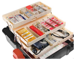
1466 Tray System for 1460EMS