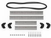
iM2200-MBEZ-B Bisel de la base (métrico)