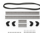
iM2306-MBEZ-B Bisel de la base (métrico)