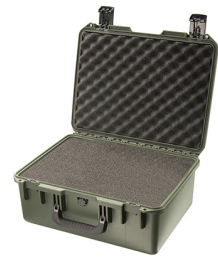
iM2450-X0001 With Foam