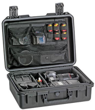
iM24XX-PHOTOPALLET Pálet para fotografía