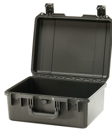
iM2450-X0000 No Foam