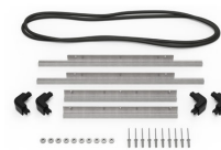
iM2450-M4-BEZEL-L Bisel de la tapa (métrico)