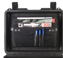
iM24XX-LIDORG Organizador de tapa