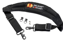
iM-STRAP-S-VER2 Correa para hombro acolchada