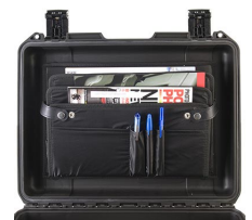
iM24XX-LIDORG Organizador de tapa