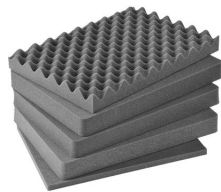
iM2450-FOAM Juego de 5 piezas de espuma de recambio