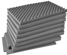
iM2975-FOAM Juego de 8 piezas de espuma de recambio