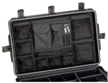
iM29XX-UTILITYORG Organizador de accesorios