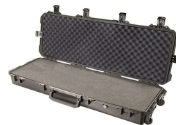
iM3200-X0001 With Foam