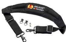
iM-STRAP-S-VER2 Correa para hombro acolchada