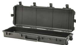
iM3200-X0000 No Foam