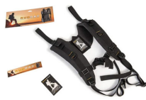
RucPac-normal Conversión de mochila RucPac estándar Hardcase