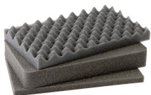
1171 Juego de 3 piezas de espuma de recambio