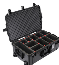
1595TP With TrekPak Divider System