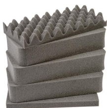
1431 Juego de 5 piezas de espuma de recambio