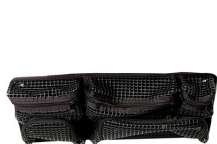
1439 Organizador de tapa