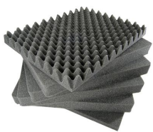
1461 Juego de 6 piezas de espuma de recambio